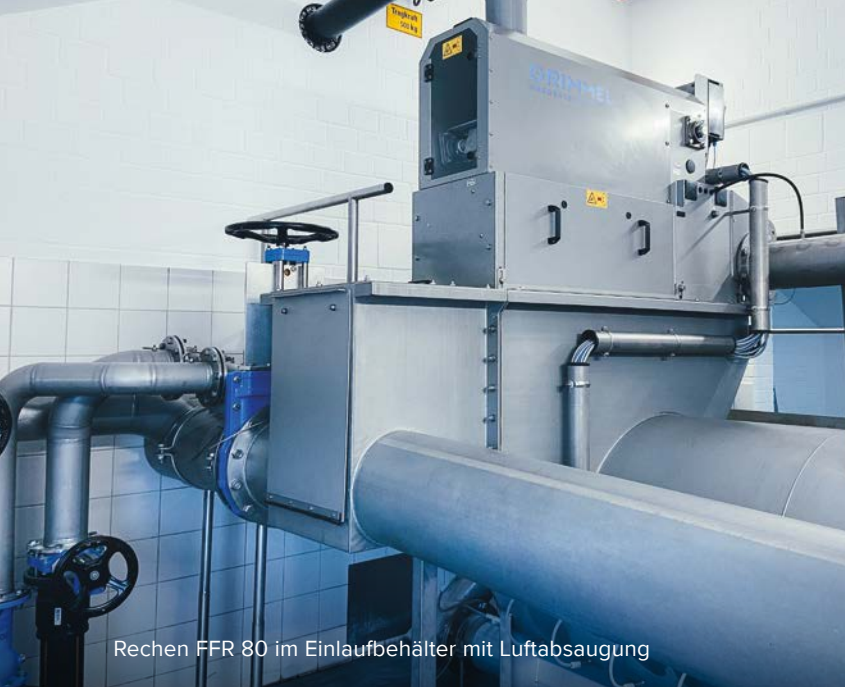
Rechen FFR 80 im Einlaufbehälter mit Luftabsaugung