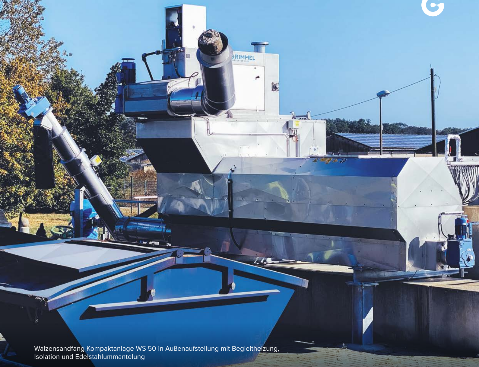
Walzensandfang Kompaktanlage WS 50 in Außenaufstellung mit Begleitheizung, Isolation und Edelstahlmantelung

Die Funktionalität der beschriebenen Sandabscheidung wurde wissenschaftlich nachgewiesen und hat sich bereits hundertfach in betrieblichen Einsätzen bewährt.