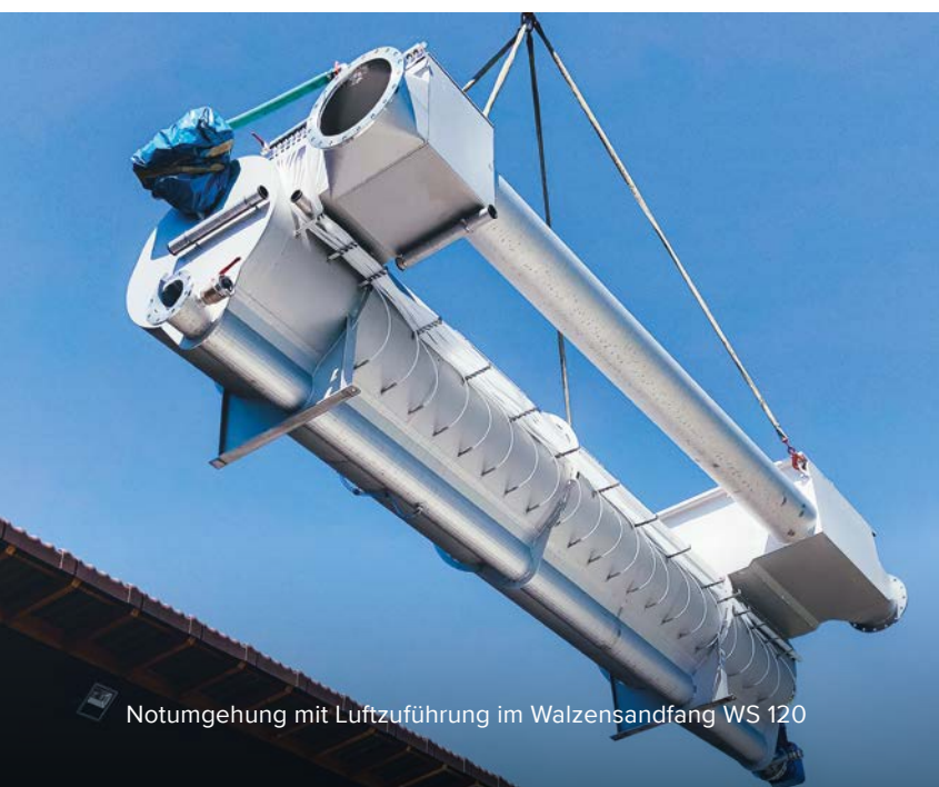
Notumgehung mit Luftzuführung im Walzensandfang WS 120

„An einem Tag betriebsbereit aufgestellt inklusive E-Technik. Einfach klasse!“