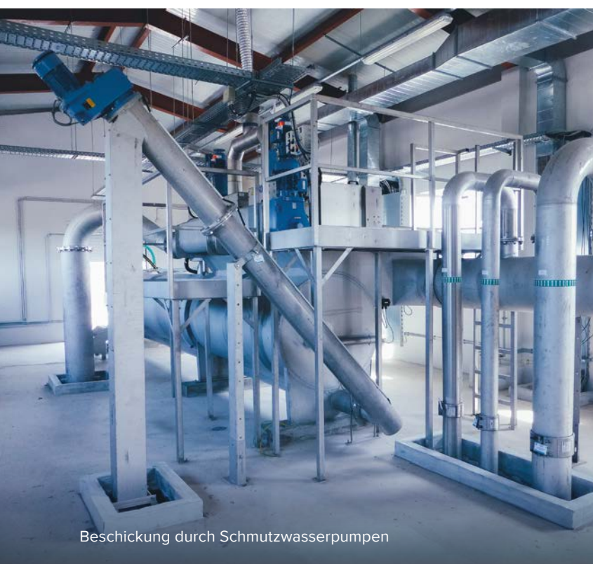
Beschickung durch Schmutzwasserpumpen

„Die einfache Fettentnahme ist bemerkenswert!“